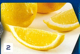
2 レモンを1/2にカット