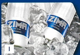
1 ZIMAをキンキンに冷やす