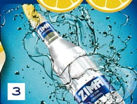
3 レモンを飲口から絞り入れて、ダイレクトに!